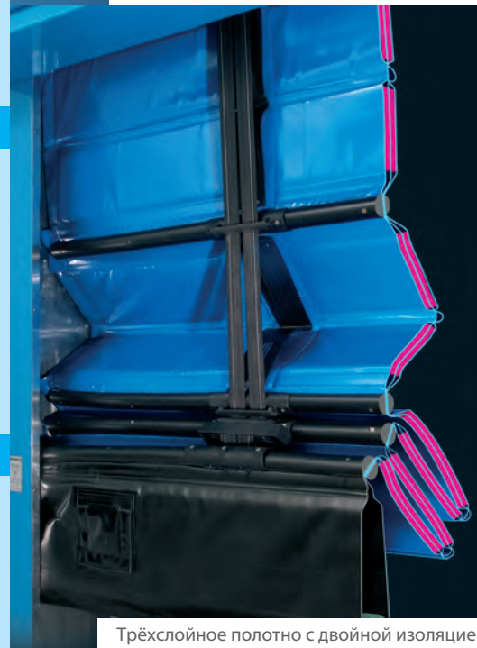
Трёхслойное полотно с двойной изоляцией

Полотно открывается не заранее, а в необходимый момент ("точно в срок") и закрывается без задержки, что сокращает время пребывания ворот в открытом положении и снижает энергозатраты до 32%.