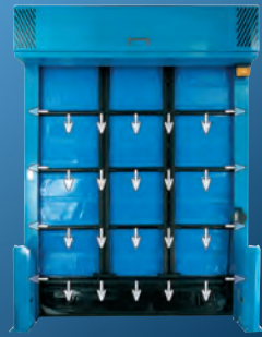
Герметичность и сопротивление давлению

Ворота C FREEZER 2 оснащены трёхслойным полотном с двойной воздушной прослойкой и теплопроводностью ( U = 1,97 \text{ Вт/м}^2\cdot\text{К} ). Дополнительные уплотнители в вертикальных боковых направляющих значительно увеличивают герметичность ворот, что исключает необходимость контрольного открытия ворот в ночное время.