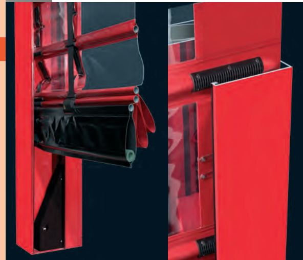
Самонесущая стальная рама

Светопрозрачные вставки позволяют персоналу видеть встречное движение. Прозрачность гарантирована на протяжении всего срока эксплуатации, поскольку материал износоустойчив, обработан составом от УФ-лучей и не подвержен деформации. Панорамные вставки охватывают всю ширину полотна ворот.