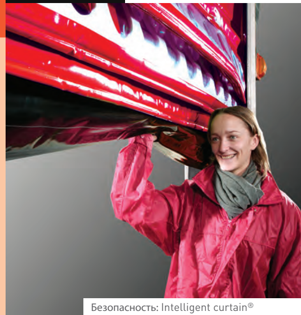
Безопасность: Intelligent curtain®

Даже если ворота подвергнутся удару и ребро жёсткости прогнётся, они будут продолжать работать без перерыва производства.