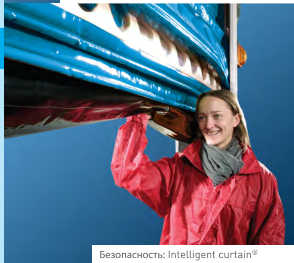
Безопасность: Intelligent curtain®

Полотно ворот C CHILL 5 сделано из материала, соответствующего всем санитарно-гигиеническим требованиям пищевой промышленности.