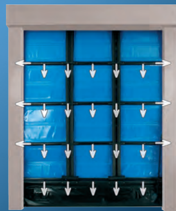
Герметичность и сопротивление давлению

Полотно открывается не заранее, а в необходимый момент ("точно в срок") и закрывается без задержки, что сокращает время пребывания ворот в открытом положении и снижает энергозатраты до 32%.